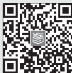
《草船借箭》 教学片段